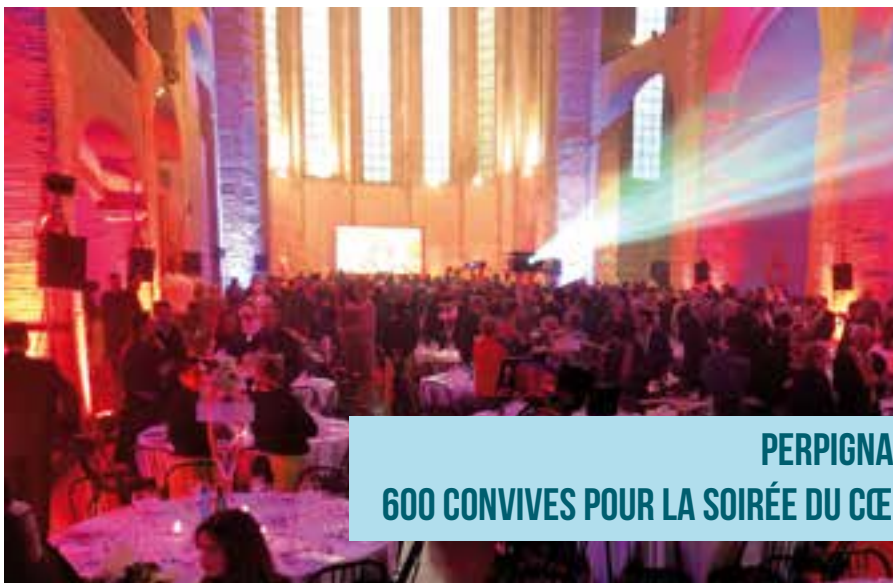
PERPIGNAN : 600 CONVIVES POUR LA SOIRÉE DU CŒUR

L'aide directe aux malades, et l'aide collective aux patients (appelée comptablement «versements à d'autres organismes» la plupart du temps hospitaliers) ont