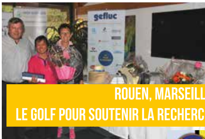
ROUEN, MARSEILLE : LE GOLF POUR SOUTENIR LA RECHERCHE

mais dans un cadre nouveau. Nous avons en effet développé de nouvelles actions afin de développer notre notoriété et collecter de l'argent pour nos missions.