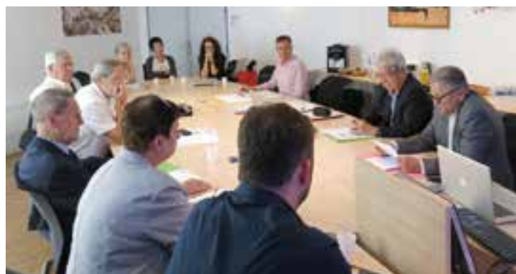
Débats et échanges lors de notre Assemblée générale 2015 à Montpellier.

Il n'en sera jamais assez remercié. Les mots ne seront jamais assez forts, et je voudrais simplement transmettre le sourire de certains patients qui vont gagner en qualité de vie.